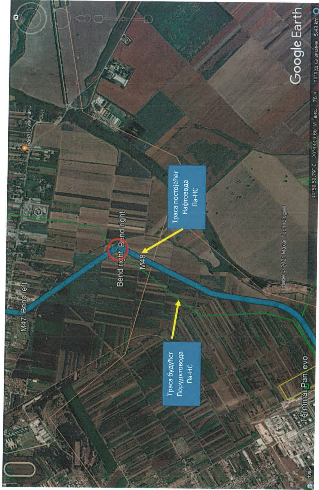
Прилог 1. Ситуациони приказ проласка трасе постојећег нафтовода ДН-2 (плава линија) и будућег продуктовода Па-НС(зелена линија) у односу на предметно подручје у КО Панчево, са приказом места њиховог потенцијалних укрштања са локацијама будућих енергетских инсталација ветрогенератора (црвени круг)